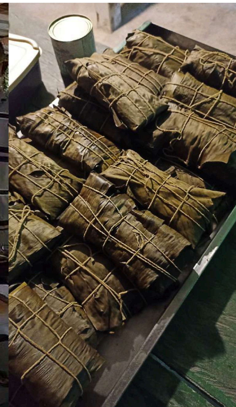
Preparo e Degustação de Hallaca (prato típico venezuelano) para turistas Dez/2025