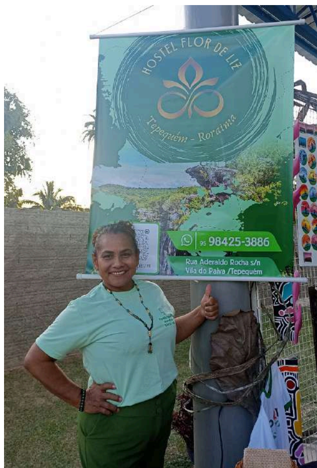
Corrida Tepequém Up Set/2024