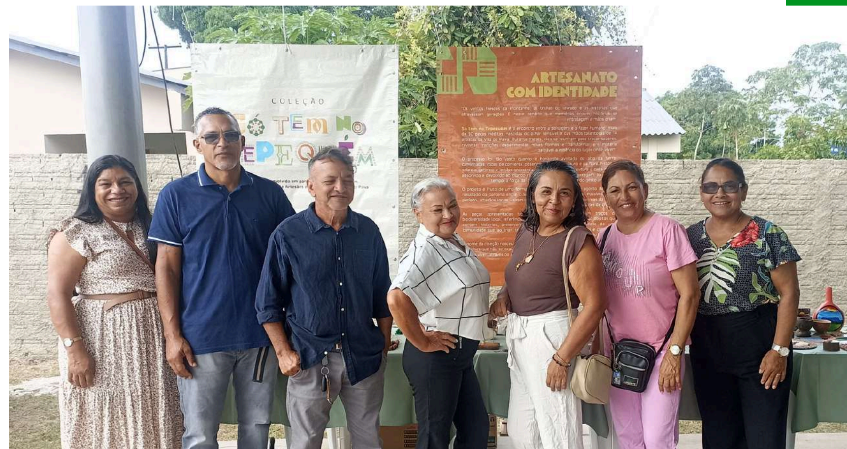
Associação de Moradores - Fev/2026