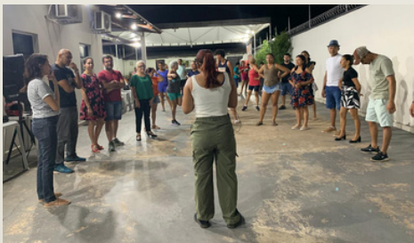
Ministra aulas gratuitas de dança para a comunidade desde 2024

Participação constante em cursos e oficinas, incluindo formação complementar em dança do ventre (2024 e 2025), reafirmando seu compromisso com o aperfeiçoamento técnico e artístico.