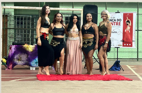
Participou de oficina de dança do ventre, com apresentação no final do curso, fevereiro de 2025.