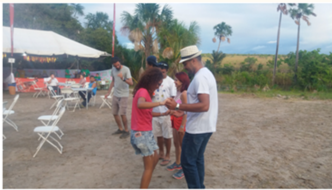
INTO THE RUPUNUNI MUSIC & ARTS FESTIVAL 2018