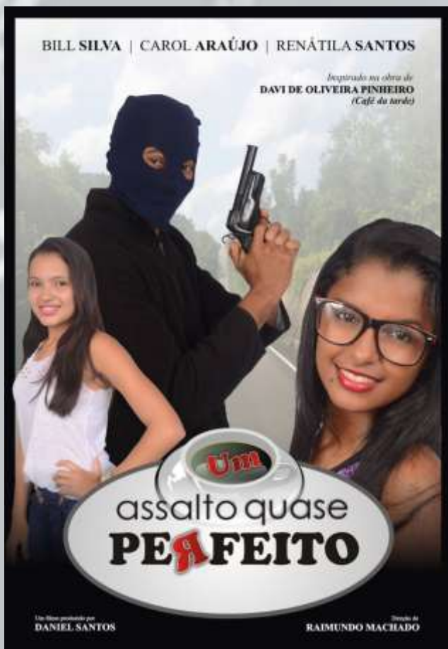
Figura 5 - Capa do projeto em DVD (2016)