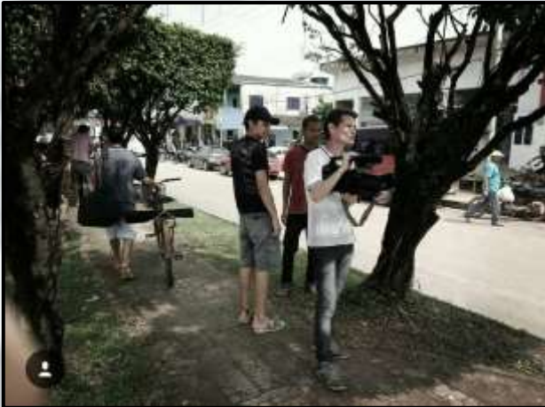
Figura 7 - Gravação de externas (2015).