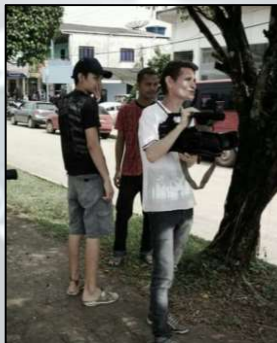
Figura 4 - Durante as filmagens do projeto 2014.