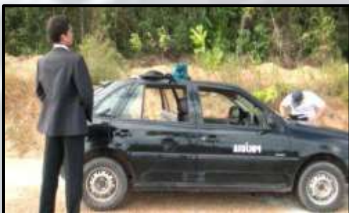
Figura 11 – Gravação de externas (2015).