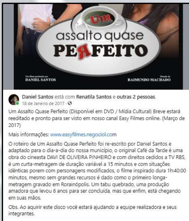
Figura 3 - Imagem compartilhada da página oficial