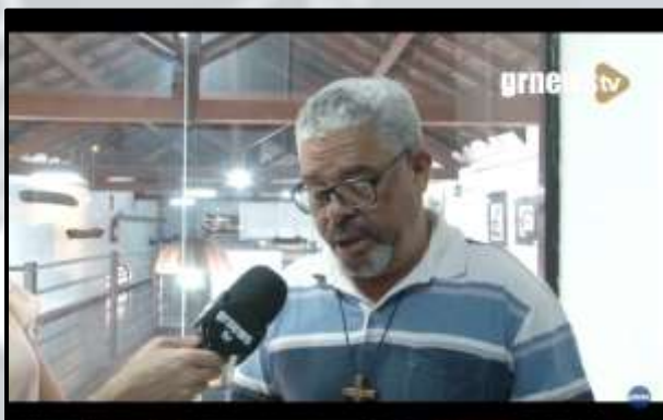
Figura 1 - Reportagem na GRNEWS

Reportagem e execução do projeto finalizado em eventos e em outros espaços culturais (Pará de Minas – MG)