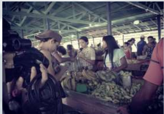
Figura 10 – Filmagem na feira (2015).