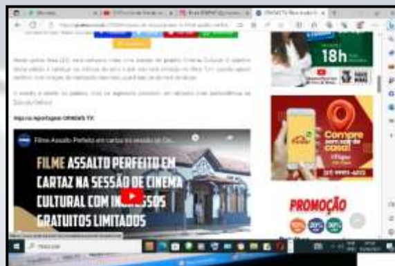
Figura 2 – Divulgação no site GRNEWS