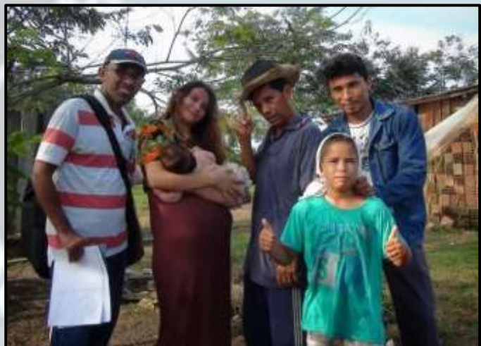
Figura 12 – Gravação de externas (2015).