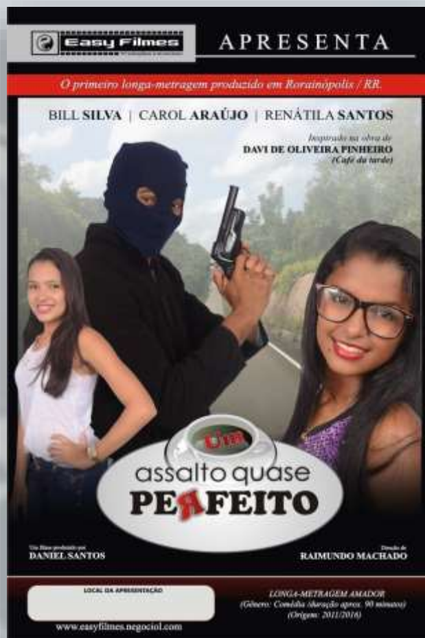
Figura 6- Cartaz do filme (2016)