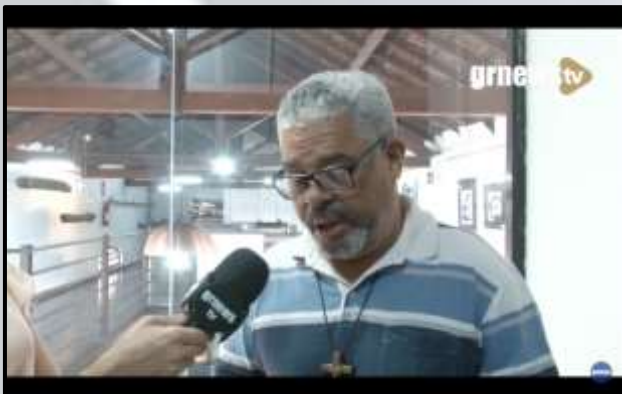
Figura 9 - Exibição do projeto em Pará de Minas MG.