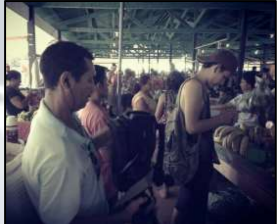
Figura 8 – Filmagem na feira (2015).