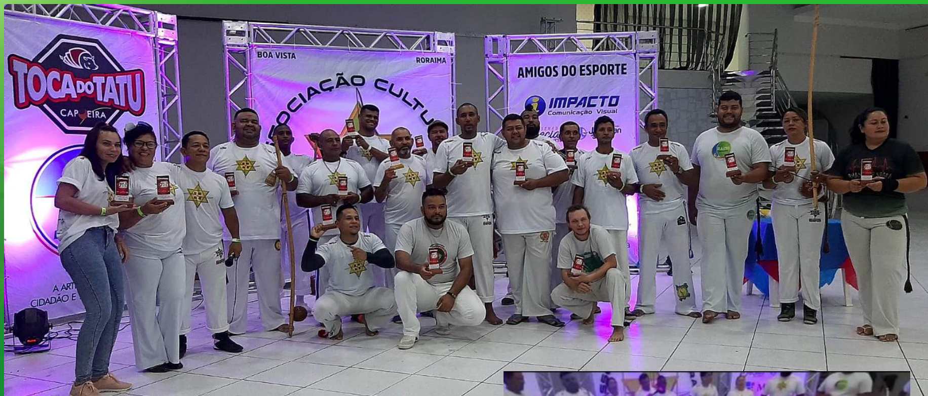
Evento em Setembro de 2020 no Espaço Mosaico, sobre minha coordenação