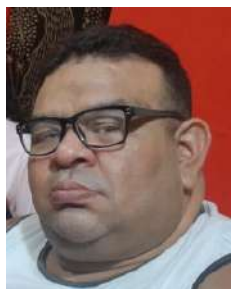
Contra-Mestre Sangue Bom Boa Vista - RR