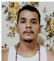
Prof. Carcará Cruzeiro do sul - AC