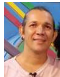
Mestre Biriba Boa Vista - RR