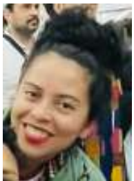
Prof. Juba Ilha de Marajó - PA