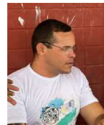
Contra-Mestre Malabim Boa Vista - RR