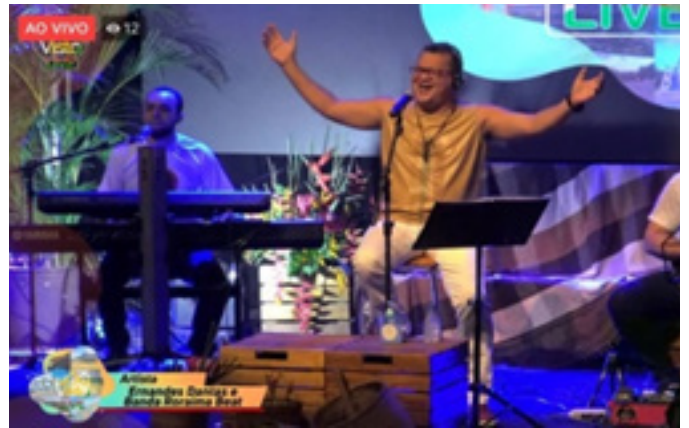
Live Prefeitura – Música: Infinito Desejo. Disponível em: https://www.youtube.com/watch?v=FmL8N4ice-Y