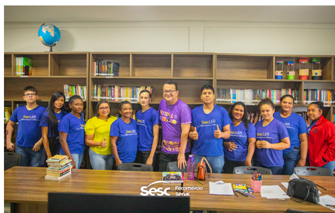
Festival Literário – Sesc Roraima (2022)