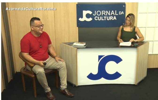
Entrevista TV Cultura: Jornal da Cultura (2023). Disponível em: https://www.youtube.com/watch?v=OeN-8ZRsnTLM