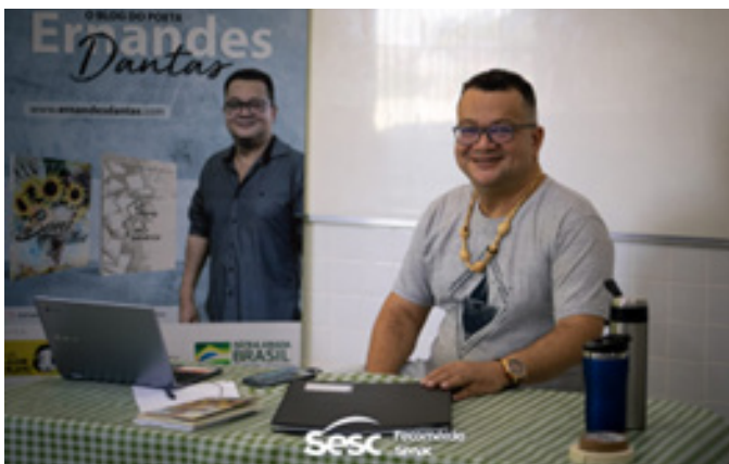
Projeto Festival Cultural Cruviana Rorainópolis – SESC Roraima (2022) e Festival Literário São João da Baliza (2023)