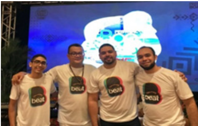
Show Canto do Poeta Teatro Municipal de Boa Vista. Disponível em: https://youtu.be/1Hj4p7MhkWM