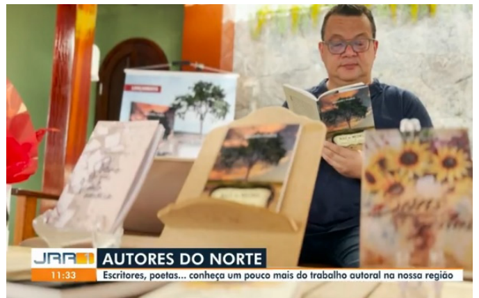
Entrevista no JRR 1: A força dos trabalhos literários autorais do norte do país. Disponível em: https://globoplay.globo.com/v/11320098/