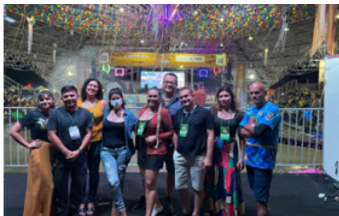
Membro do corpo de Jurados do Arraial do Parque Anauá – Governo do Estado de Roraima. (2022 e 2023)