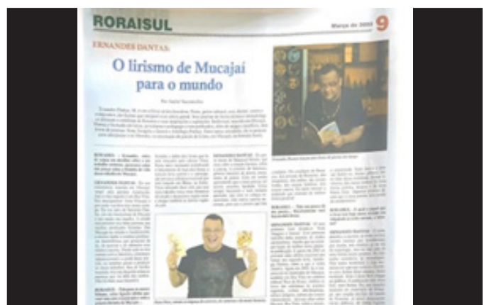
Matéria do Jornal Roraisul: Mídia Física (2022)