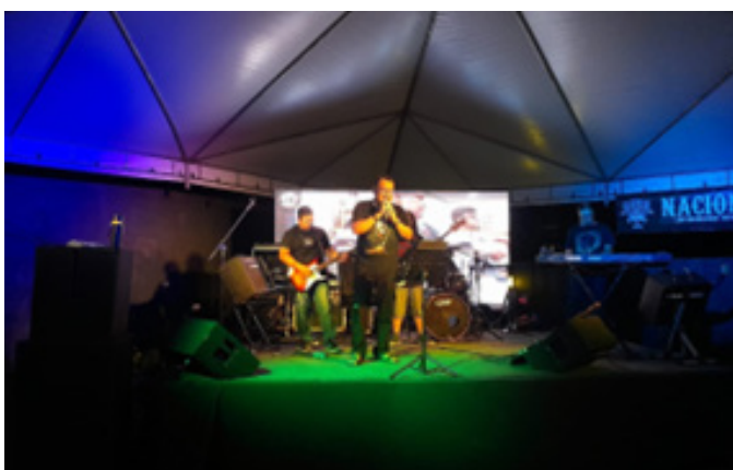
IV Aniversário do Motoclube Nacionaes – Old 174 Pub (2022)