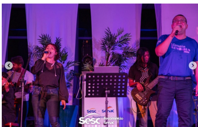
I Semana Literária do Sesc Roraima (2023). Disponível em: https://www.ernandesdantas.com/2023/05/ernandes-dantas-na.html