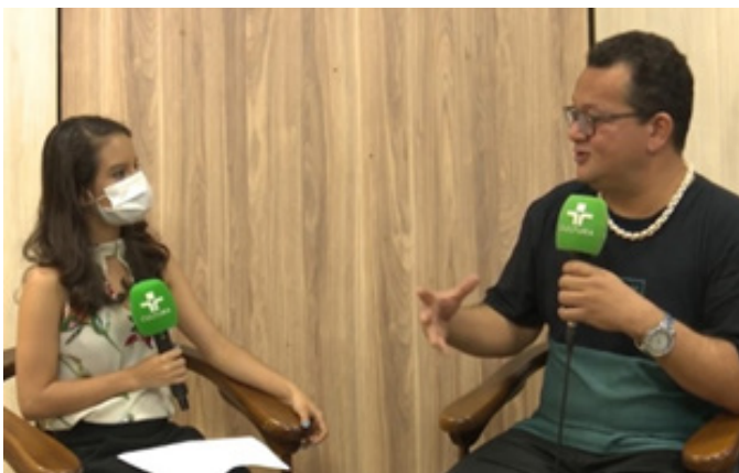
Entrevista TV Cultura: Lançamento de dois livros. Disponível em: https://www.facebook.com/tvculturaroraima/videos/505702744504004