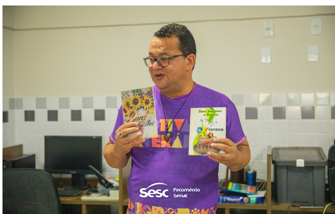
Festival Literário – Sesc Roraima (2022)