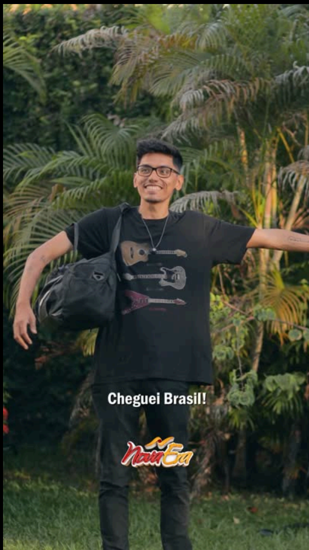
04 VÍDEOS CURTOS VIRAIS I BBB 2026 - Nova Era