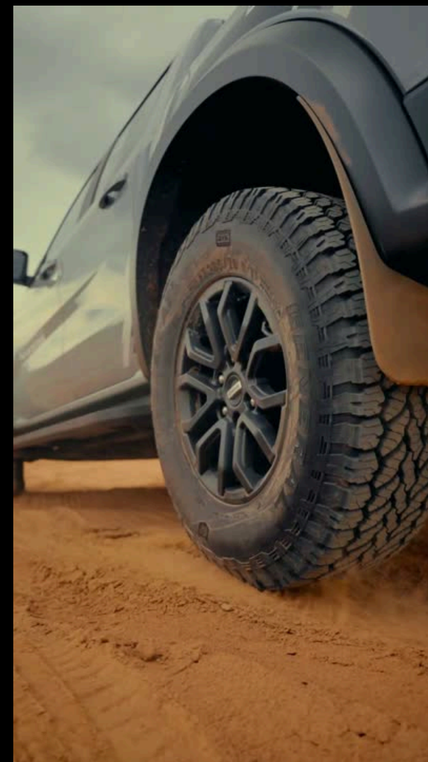
06 VÍDEOS CURTOS VIRAIS III Ford Experience - Ford Detroit