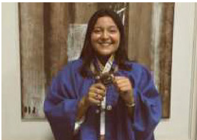
Yasmin Dádiva ocupa a cadeira nº 92 da Academia de Literatura, Arte e Cultura da Amazônia (ALACA).