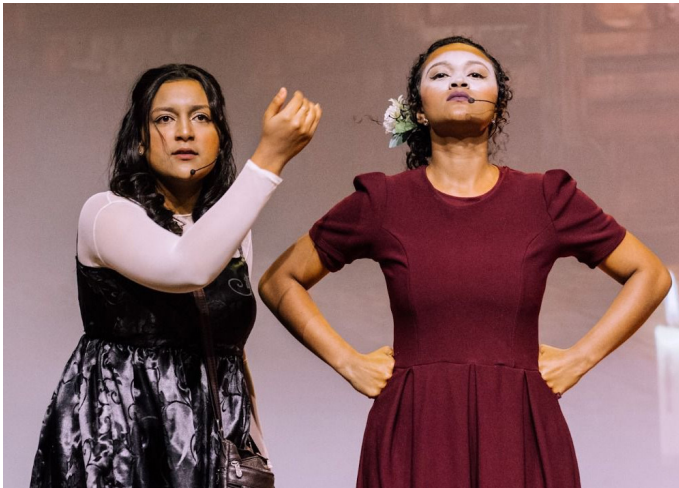
Peça: Pedra Preciosa - Paz Church Boa Vista (2023).