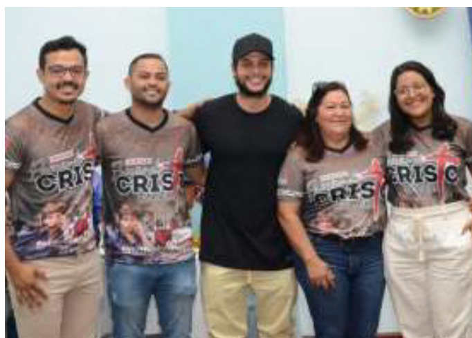
Dirigiu a 39ª Edição do Espetáculo “Paixão de Cristo” em Mucajaí RR (2023). https://www.youtube.com/live/5zS2_9xbdc?feature=share