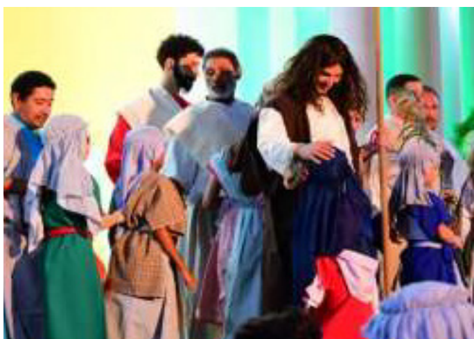
Dirigiu a 39ª Edição do Espetáculo “Paixão de Cristo” em Mucajaí RR (2023). https://fb.watch/k83PTfyU1U/?mibextid=cr9u03