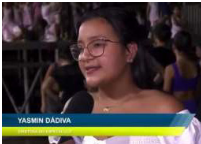
Dirigiu o Espetáculo Teatral “Clara e o Quebra Nozes, Encanto de Natal” da Assembleia Legislativa https://www.youtube.com/live/oMI2MCdJHQM?feature=share