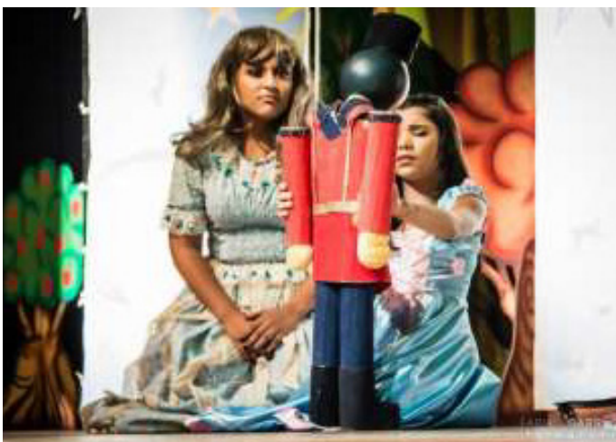
Personagem: Lourdes no Espetáculo Clara e o Quebra Nozes - Musical de Natal (2019).