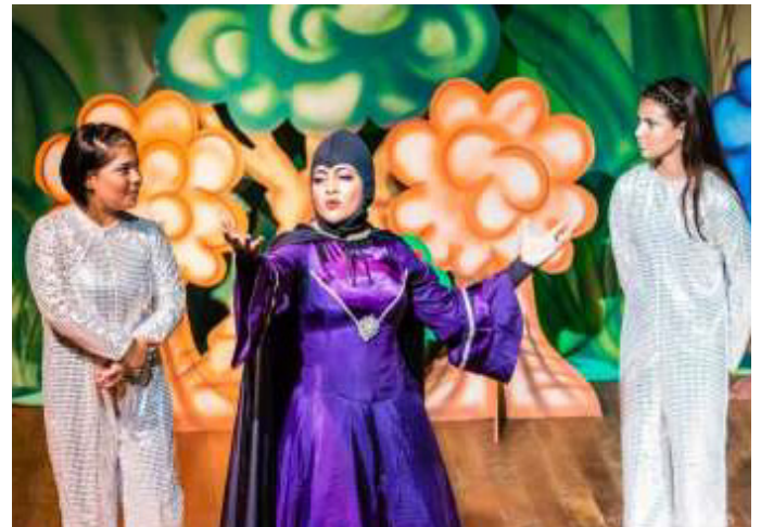
Personagem: Rainha Má no Espetáculo Branca de Neve (2019).