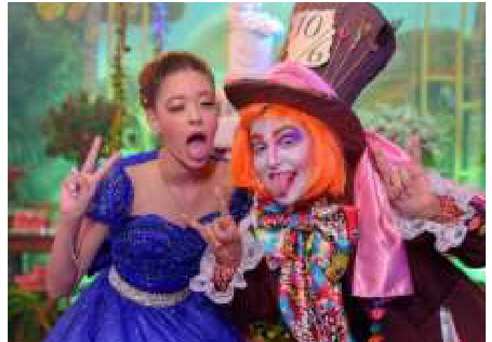
Personagem: Chapeleiro Maluco - Animação de Festas (2022).