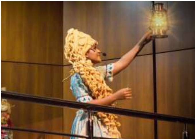
Personagem: Ester no Espetáculo Cinderela, Meu Primeiro Amor (2019).