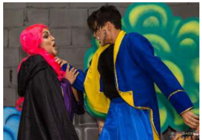
Personagem: Bruxa no Espetáculo A Bela e a Fera (2019).