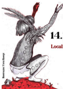
Ilustração: Vera Blumpp

Local: Associação KAPOI - Rua Rio Mau, 137, Araceli