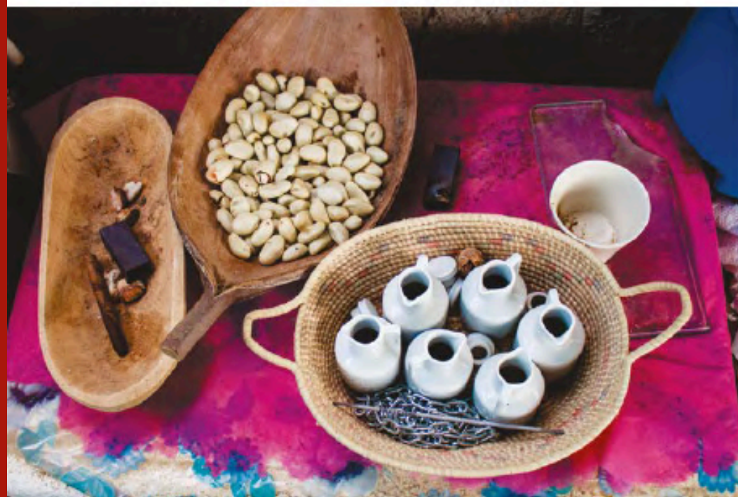
Fotografia: Oyá Gambele. Valmik Mota, 2019.