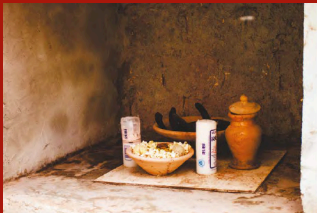
Fotografia: Oyá Gambele. Valmik Mota, 2019.