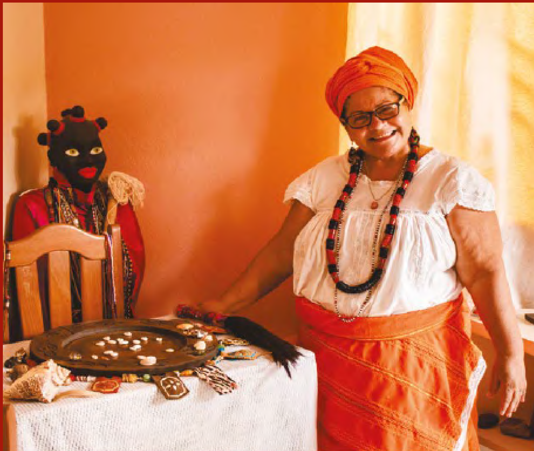
Fotografia: Dina de Oyá, Mãe Orlandina de Matos Farias. Ebon Dina de Gambele. Valmik Mota, 2019.